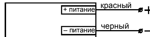
Рис.3. Схема подключения излучателя МикРА Ф4И.

Изготовитель: ООО «МикРА», Украина, 03057, г. Киев-57, а/я 11. т. +38-(044)-201-87-55 (отдел продаж) т. +38-(044)-201-86-20 (техническая поддержка) Интернет: http://www.micra.com.ua